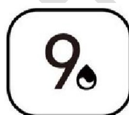
9 stepeni gustine drveta